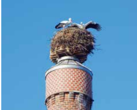
Geisenfelder Storchennest auf dem Brauereikamin