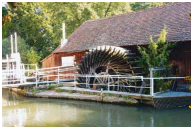
Mühlrad an der Hatzlmühle

Die renaturierte Ilm schlängelt sich ab Nötting (unterer Bildrand) in einem etwa 100 Meter breiten Auwaldband Illmendorf (oberer Bildrand) zu. Links oben der Lorenzisee.